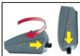
Cubierta reversible para salida de cable sobre o bajo la carcasa, T31P