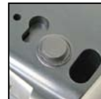
Ranuras en forma de ojo de cerradura integradas para montaje en pared sin soportes, T31P