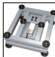
Tamaño "R" versión de acero inoxidable

Diseño en estructura tubular angular sin comprometer la durabilidad