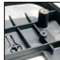
Las nervaduras estructurales minimizan la flexión y aportan resistencia a la carcasa, T31P