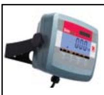
Indicador T31P mostrado con soporte de montaje en pared opcional