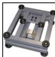
Tamaño "R" versión de acero pintado