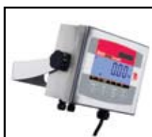
Indicador T32XW mostrado con soporte de montaje en pared incluido