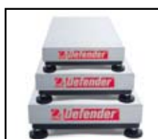
Tres tamaños de base