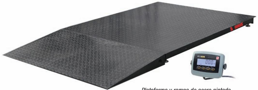
Plataforma y rampa de acero pintado mostrada con indicador T31P