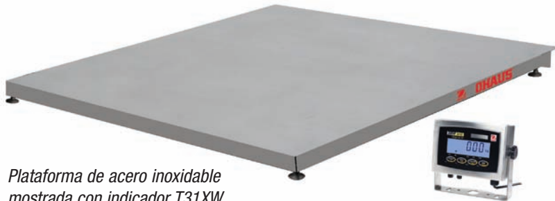
Plataforma de acero inoxidable mostrada con indicador T31XW

Plataformas y básculas de montaje en suelo